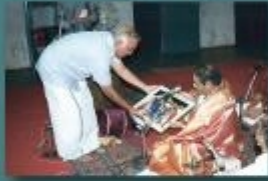
திருவாசகம், தீவ்வியிர்ப்பந்தம் வாய்ப்பாட்டு : பதியமுதன் மதுரை திரு. T.N. வேலுசேகரன்