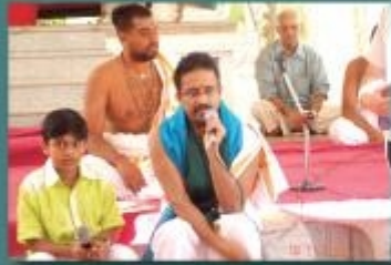
ஸ்ரீ ஸ்வாமிநி அலாக்கவின் விஜயம், அநுநறை இடம்: பாரதிய வித்யா பவன் பள்ளி, ஜூப்லி ஹில்ஸ், ஹைதராபாத் தேதி: 16.11.07