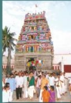
ஸ்ரீ ஸ்வாமிநி அலாக்கவின் விஜயம் இடம்: ஆம்பூர் தேதி: டிசம்பர் 1,2,3