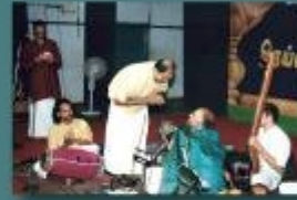
அருணகிரிநாதர் மற்றும் அருணாசலகவிராயர் பாடல்கள் வாய்ப்பாட்டு : திரு. N. விஜய்சீவா