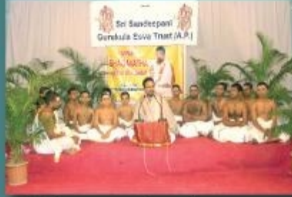
ஸ்ரீமத் பாகவத ஸப்தாஹம் - அநுநறை இடம்: கோவல் உயர்நிலைப் பள்ளி, செகந்திரபாள்த் தேதி: நவம்பர் 11 - 15