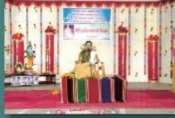
'ஹரே ராம' மஹாமத்திர நாமகீர்த்தனை கூட்டுப் பிரார்த்தனை இடம்: டவுன் ஹால், கடலூர் தேதி: 3.11.07