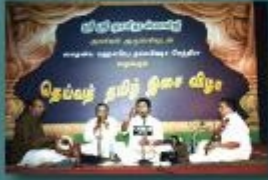
முத்தத்தாண்டவர், மாரிமுத்தம்பிள்ளை, செயலசிறகுண பாடிகள் பாடல்கள் வாய்ப்பாட்டு : டாக்டர். R. சீனேஷ்