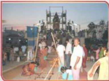
ஏப்ரல் 13 தமிழ் சித்திரை விழா - மதுராபுரி ஆஸ்ரமம் கன்யாகுமரி ஜயமலையாள் சன்னதி லகஷ்மீ