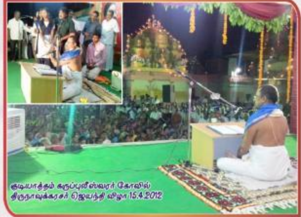
குடியாத்தம் கருப்பலீஸ்வரர் கோவில் சிஞ்ஞாவுக்கரசர் ஜெயந்தி விழா 15.4.2012