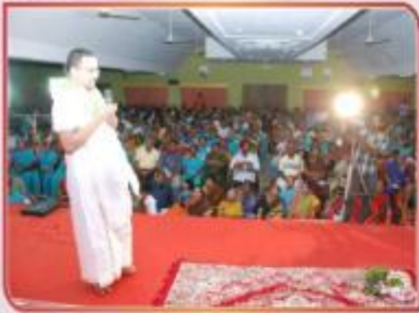
ஏப்ரல் 6 தஞ்சை கத்திரை மதுரையில் மதுராமத்திர கூட்டு பிரார்த்தனை