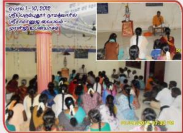
ஏப்ரல் 1 - 10, 2012 ஸ்ரீபெரும்புதூர் நாமதீவாளில் ஸ்ரீராமானுஜ ஸ்வபயம் - ஸ்ரீராமானுஜ உபன்யாசம்