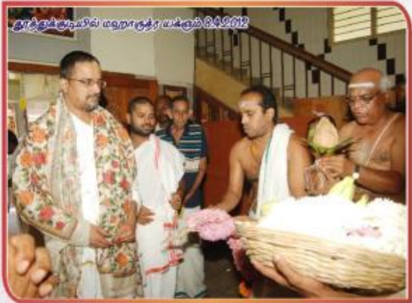
தூத்துக்குடியில் மதுராஹி யக்ஷம் 04.09.12