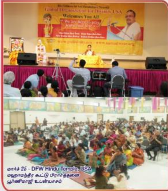
மார்ச் 25 - DFW Hindu Temple, USA மதுராமந்திர கூட்டு பிரார்த்தனை பூர்ணிமாஜி உபன்யாசம்