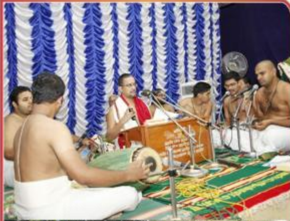
மார்ச் 25 - 31, சிவன்னை யாரதி தானக் காவனி ஸ்ரீ புவனேஸ்வரி ஆம்மன் கோவிலில் பக்தி யஜ்ஞயம் ஆயினியாதம்