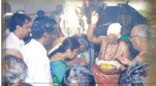
ஏப்ரல் 12, 2012 திருநாங்கூர் திருஅரிமேய விண்ணகரம் மணியாறு கரையில் மதுராபலி