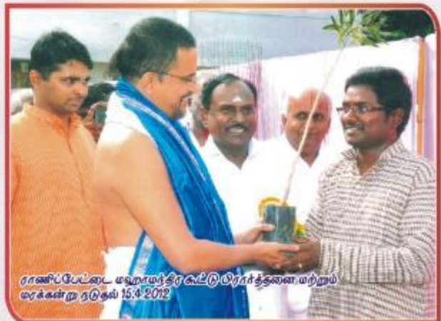
ராணிப்பேட்டை மஹாமக்திர கூட்டு ரொர்த்தனை மற்றும் மரக்கன்று நடுதல் 15.4.2012