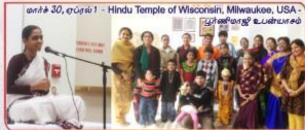
மார்ச் 30, ஏப்ரல் 1 - Hindu Temple of Wisconsin, Milwaukee, USA - பூர்ணிமாஜி உபன்யாசம்