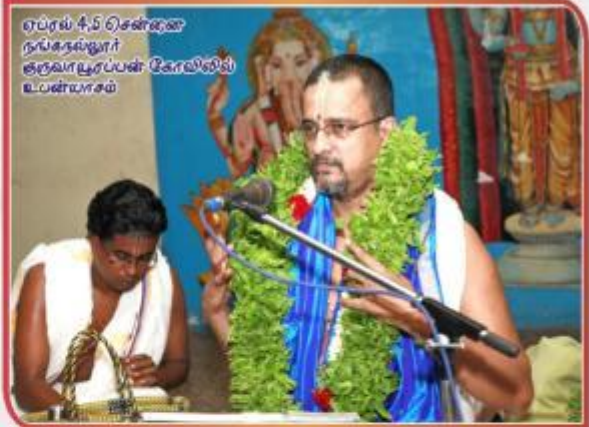
ஏப்ரல் 4, 5 சென்னை நங்குளியூர் குருகிராமராயன் கோவில்லில் உபநாயகம்