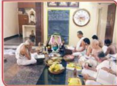
மார்ச் 23-31 சென்னை பிரேமிக பவனத்தில் ஸ்ரீமதி ராமாயண மூலபாராயணம்